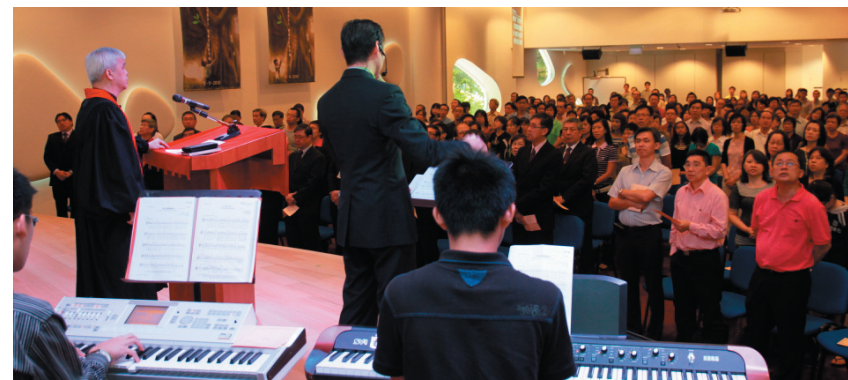
300多人出席了福康宁聚会的献堂典礼。

乌节路聚会自7月4日起逢主日举行区会展览，让来自不同区会的弟兄姐妹轮流在个别主日作宣传展出，希望会友能透过区会过去的活动录像、照片的展示，产生兴趣参加。举行至8月1日的区会展览，共有20余人填写参加表格，表示有意参加区会。