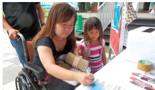
购买纪念邮票、大家齐心为建堂出钱出力。