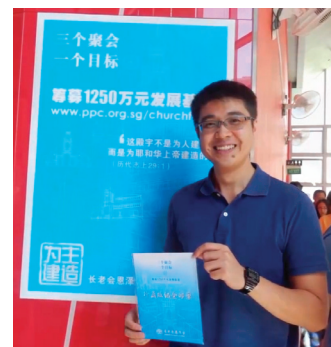
不分彼此, 互相激励, 做成主工。