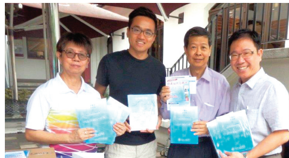
信心认献, 同心尽力。