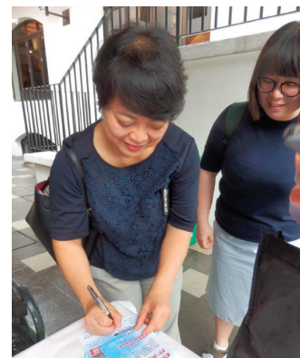
一笔一划, 表达我愿奉献的心。