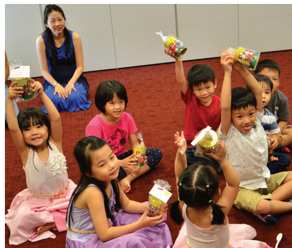
爱主教会, 我们也要在建堂工作上有份!