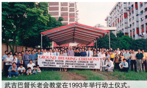
武吉巴督长老会教堂在1993年举行动土仪式。

我们能在现有的教堂聚会敬拜, 是因以前的会友的坚持努力。现在我们也可以为扩建工作作出贡献, 让以后世代都受益, 让传承的精神永续!