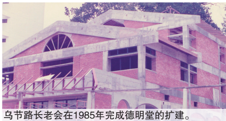
乌节路长老会在1985年完成德明堂的扩建。