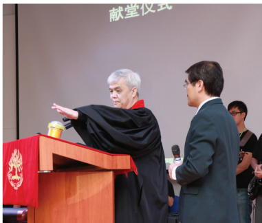
福康宁聚会2010年9月11日举行献堂典礼。