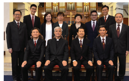
发展基金筹委会由跨聚会的老中青代表组成。

请在祷告中记念筹委会在紧锣密鼓进行的几项筹款计划, 继续有更多的弟兄姐妹能在为主建造的事工上, 先求祂的国和祂的义, 有份参与与全力支持, 完成主托付给我们“这殿宇不是为人建造, 而是为耶和華上帝建造的”这个使命, 兴旺福音, 荣耀主名。