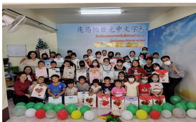
透过中文学校向当地的人传福音