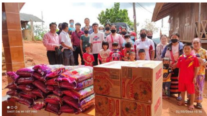
到贫困村庄分发物资