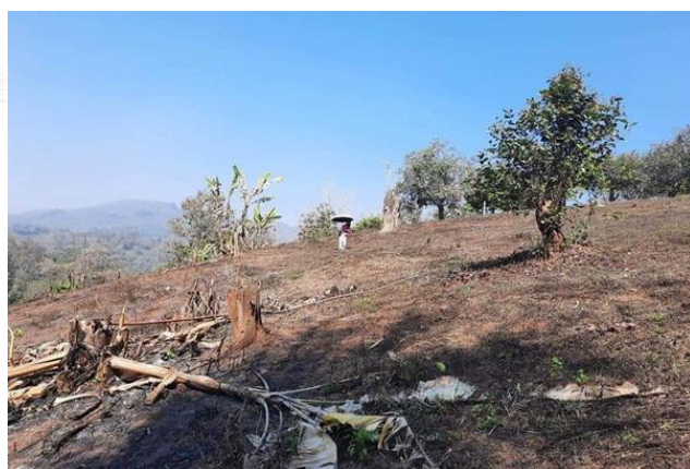
在计划建学校当中，求主预备