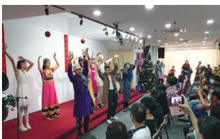
2022年圣诞节的平安喜乐