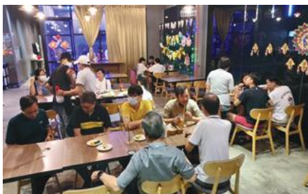
青年小组福音晚宴聚会

短宣队与宣道教会的成人家庭小组,也在星期六与星期日的两个早晨,进行了家庭小组早餐会活动,一同唱诗、祷告和彼此的分享。这让短宣队和成人家庭小组在主里建立了爱的团契。