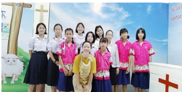
庞马帕牧养学生中心